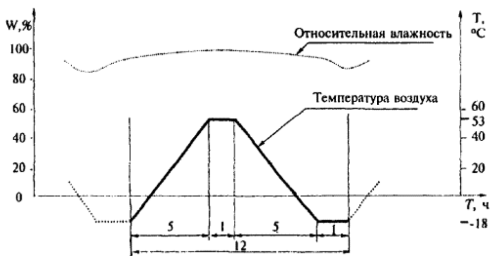
Рисунок А.2 - График одного цикла испытаний (первая часть испытаний по режиму IV)

- вторая часть испытаний заключается в воздействии на образцы постоянной температуры (58\pm 1) °C и относительной влажности воздуха \geq 95\% в течение 7 недель.